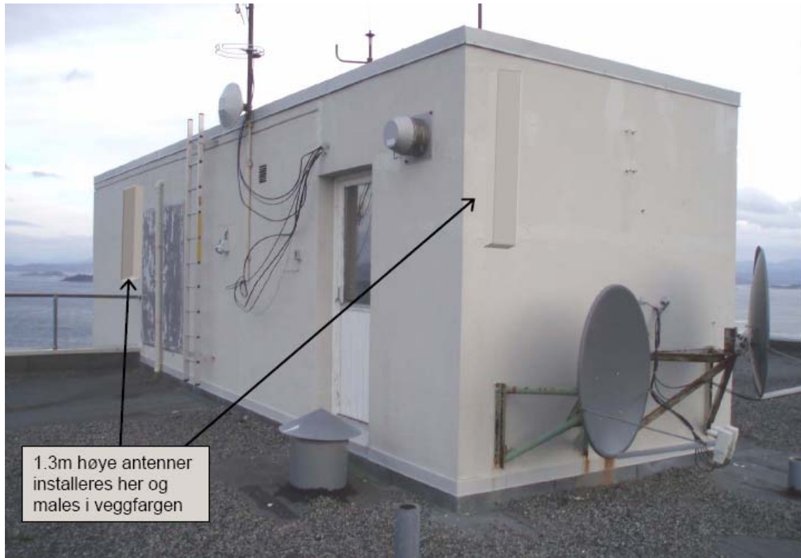
1.3m høye antenner installeres her og males i veggfargen