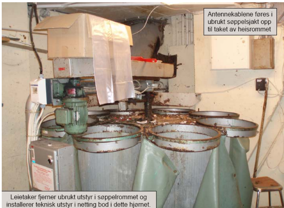
Antennekablene føres i ubrukt søppelsjakt opp til taket av heisrommet