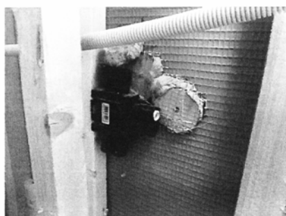
Tetting utført med flise lim. Og Litex plater.