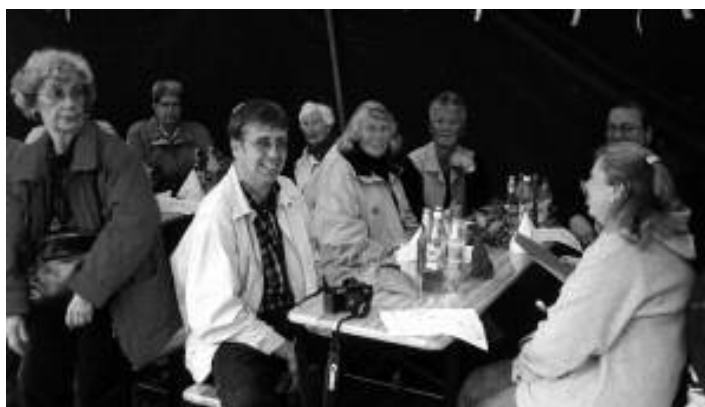
Bare fornøyde og glade beboere !