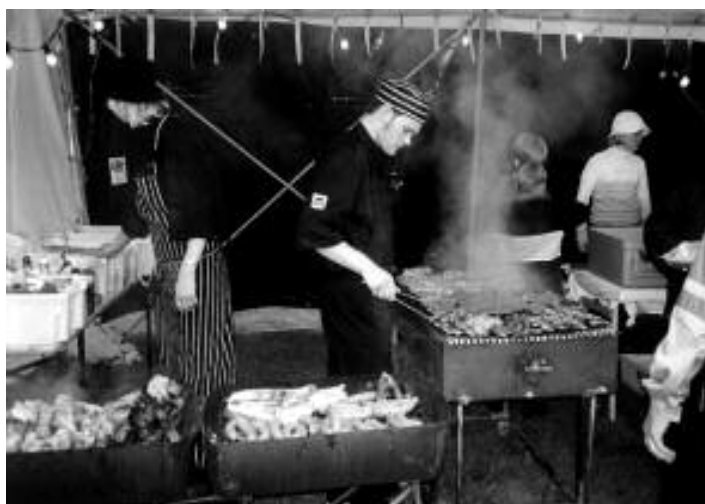
Kokkene i fullt arbeid. mmmmm . . . .

PS. Det vil komme en overraskelse på døren din før jul !